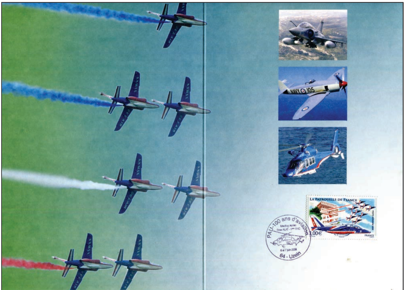
Ref F. 6-6-2009 Uzein Pau 100 ans d'aviation Obliteration Temporaire Encart avec TP "Patrouille de France"