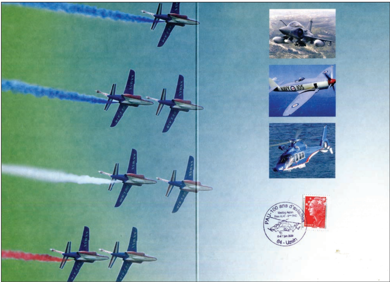
Ref C. 6-6-2009 Uzein Pau 100 ans d'aviation Obliteration Temporaire Encart avec TP "Marianne rouge"