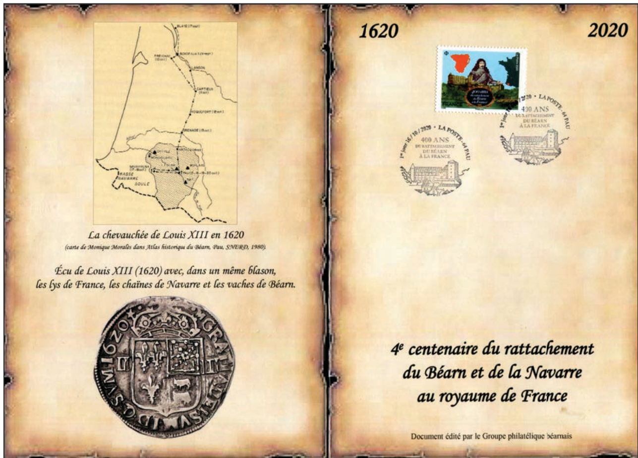
Ref J. 16-10-2020 Pau 400e anniversaire rattachement du Béarn à la France 4 € Oblitération Premier Jour Encart