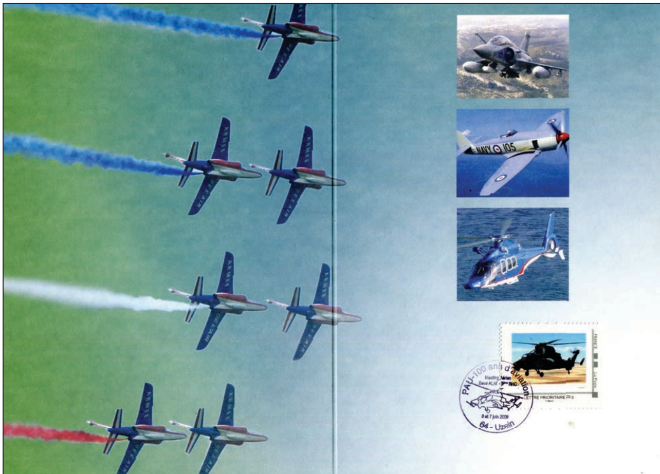
Ref D. 6-6-2009 Uzein Pau 100 ans d'aviation Obliteration Temporaire Encart avec Timbre à Moi "Tigre"