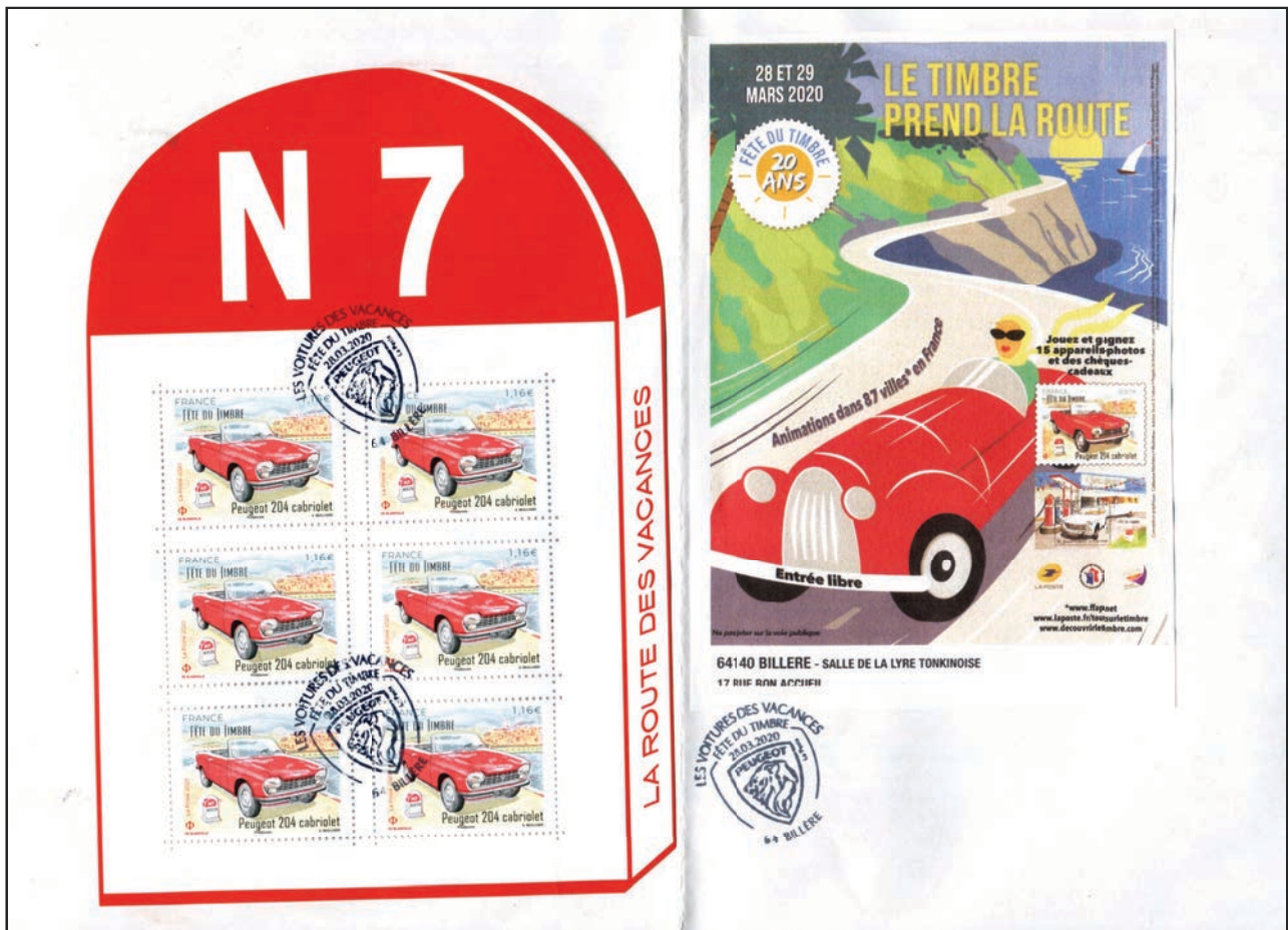
Ref I. 28-3-2020 Billère Fête du timbre 6 € Oblitération Premier Jour Enveloppe grand format avec bloc géant 6 TP