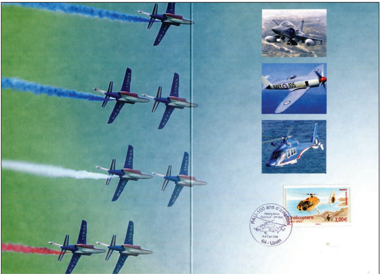
Ref E. 6-6-2009 Uzein Pau 100 ans d'aviation Obliteration Temporaire Encart avec TP "Hélicoptère"